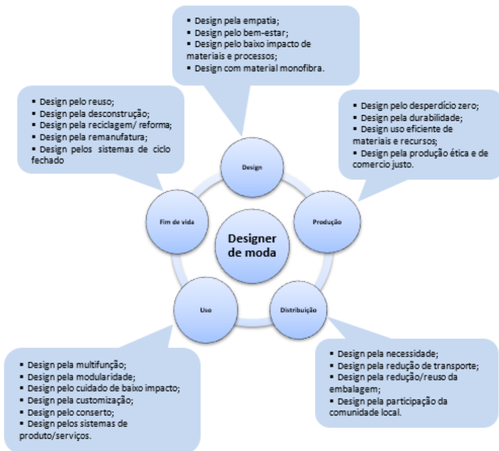
Figura 2 – O uso de estratégias de design sustentável.

O potencial dessa prática no design de moda considera o pensamento do ciclo de vida e a incorporação de estratégias de design sustentáveis como os requisitos fundamentais para inovações no processo de desenvolvimento de produtos de moda. Essa preocupação emergiu tanto de algumas empresas, como de legislações, movimentos ambientalistas e de consumidores conscientes (GWILT, 2012; FLETCHER, 2011; BERLIM, 2012).